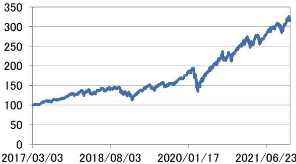
世界情報技術株式指数(現地通貨建て)

・世界情報技術株式指数(現地通貨建て)は、基準日前営業日のMSCI オールカンントリー・ワールド インデックス/情報技術(税引き後配当込み、現地通貨建て)を基に2017年3月3日を100として指数化したものです。