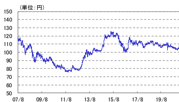
米ドル/円 為替レート 2007/08/13~2021/04/30