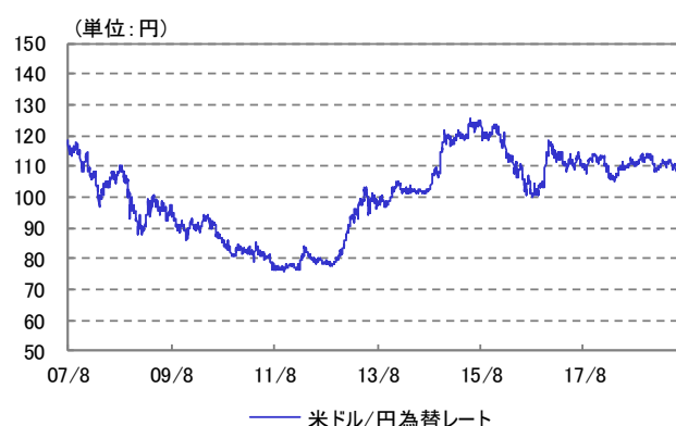
米ドル/円 為替レート 2007/08/13~2019/07/31

※ 設定時2007年8月13日を10,000として指数化しています。 ※ 2016年8月23日まではドイツ銀行グループ商品指数(円建て為替ヘッジなし)を、2016年8月24日からはCRB指数(円建て為替ヘッジなし)を指数化しています。