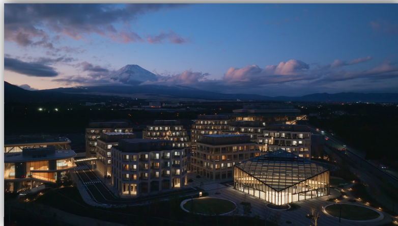
富士山を背景にした 遠景のウーブン・シティ