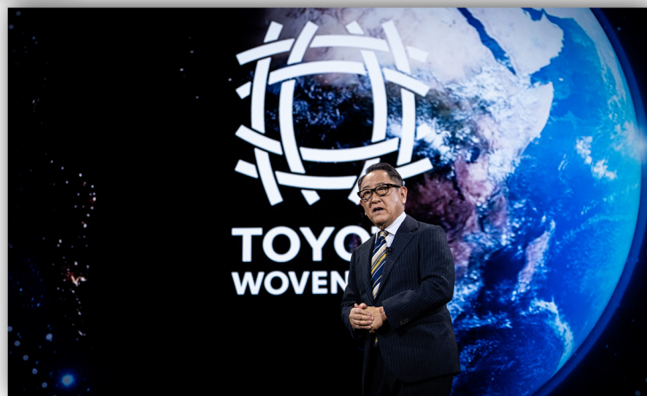
プレゼンテーション中の豊田会長